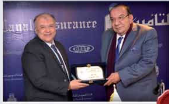
المركز الأول فرع رجال الأعمال