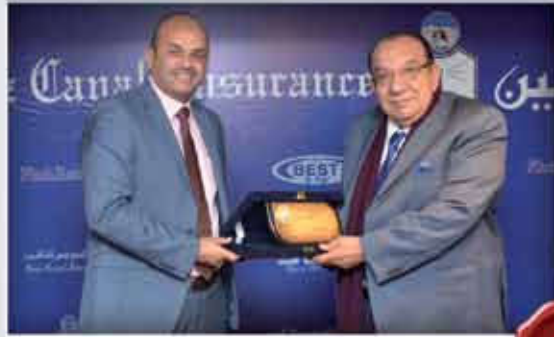
المركز الثاني فرع الإسكندرية