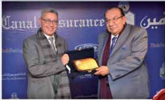
المركز الثالث فرع دمنهور