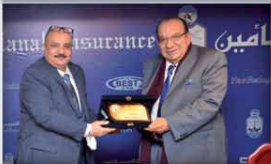
المركز الرابع فرع مصر الجديدة تريومف