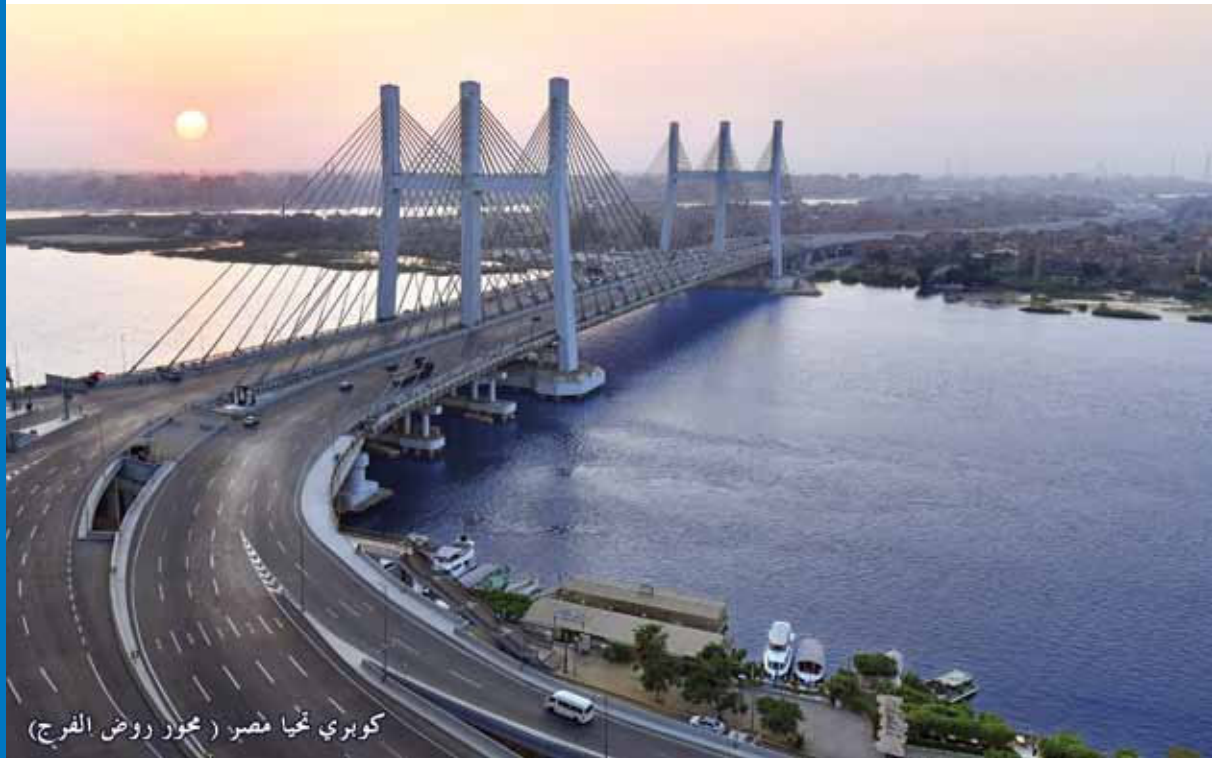
كوبري نجيا مصر ( محور روض الفرج)