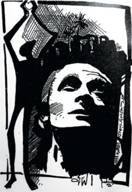
لوحة (الثالثه) الفنان الراحل البصري ابو العين

* قد تَعْتَرِيكَ مِنَ الْحَيَاةِ كَابَةٌ تُذَكِّي الأَسَى وتَشْلُ نَبْضَ الخَافِقِ فَتَوُدُّ لو تَبْكِي وَمَا مِنْ أدمِعِ وتَظَلُّ مَحْتَنِقًا وَمَا مِنْ خَانِقِ وتَظُنُّ أَنَّكَ هَالِكٌ حَتَّى إِذَا أَعْيَاكَ عُسْرُكَ جَاءَ يُسْرُ الخَالِقِ